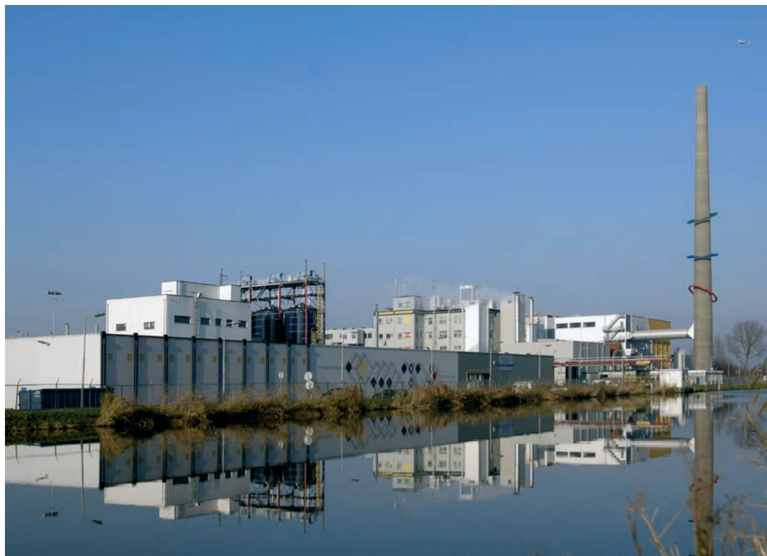
Forbo Linoleum, Assendelft